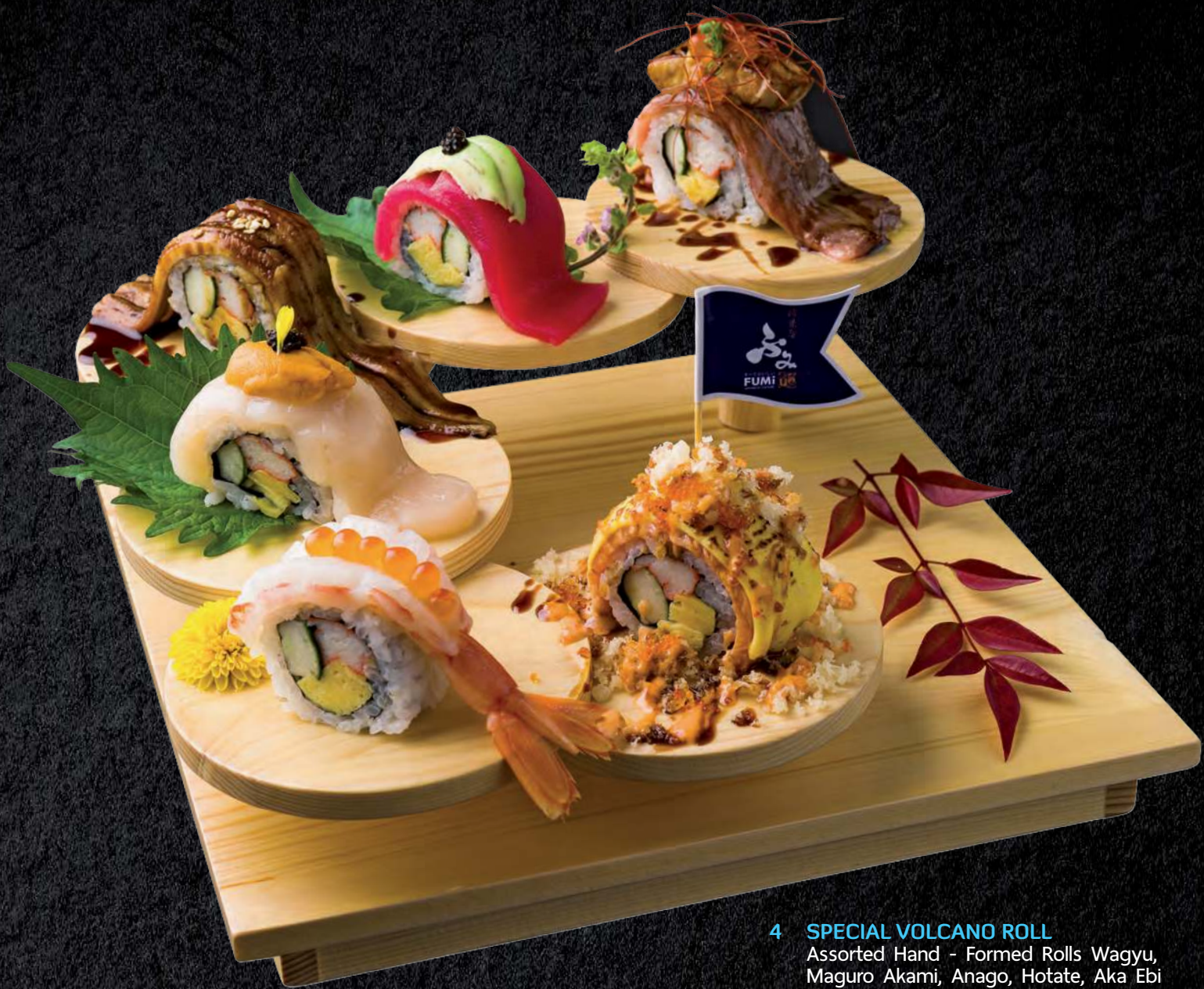
4 SPECIAL VOLCANO ROLL Assorted Hand - Formed Rolls Wagyu, Maguro Akami, Anago, Hotate, Aka Ebi and Salmon 和牛 鲔鱼肚 海胆 贝柱 甜虾 三文鱼 สเปเชียล โวคาโน โรล 890.-