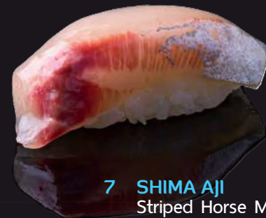
7 SHIMA AJI Striped Horse Mackerel 竹莖魚 ปลาชิมาะอาจิ 170.-