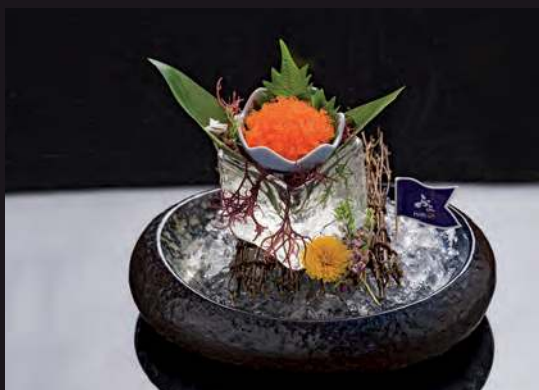
18 TOBIKO Flying Fish Roe 蝦卵 ไข่กุ้ง 200.-