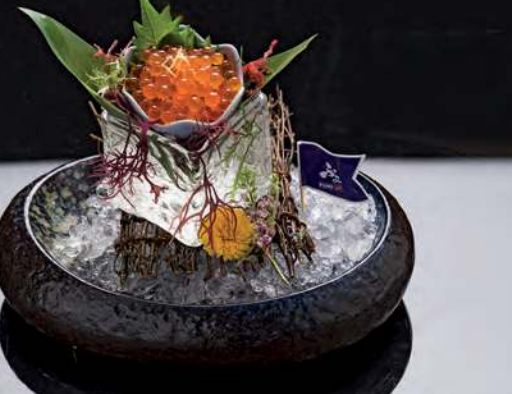
17 IKURA Salmon Roe 三文魚卵 ไข่ปลาแซลมอน 430.-