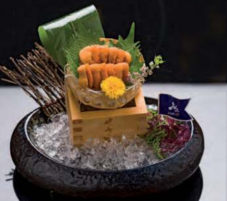
16 NAMA UNI Fresh Sea Urchin 海胆 ไข่หอยเม่น 1,500.-