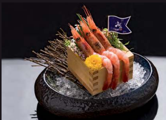
12 AMA EBI Sweet Shrimp 甜蝦 กุ้งหวาน 350.-