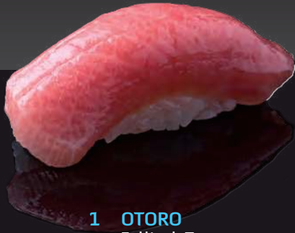
1 OTORO Fattiest Tuna 大鮪魚 เนื้อส่วนท้องโอดโอรุ 500.-