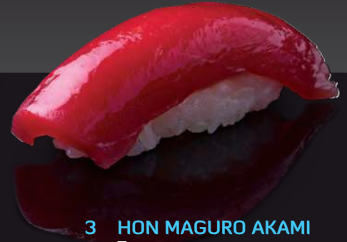
3 HON MAGURO AKAMI Tuna 鮪魚 เนื้อส่วนหลังปลาทูน่า 180.-