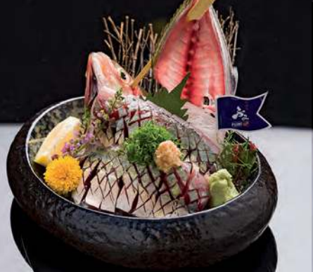
10 AJI Horse Mackerel 竹莢魚 ปลาทูกางเหลืออง 350.-