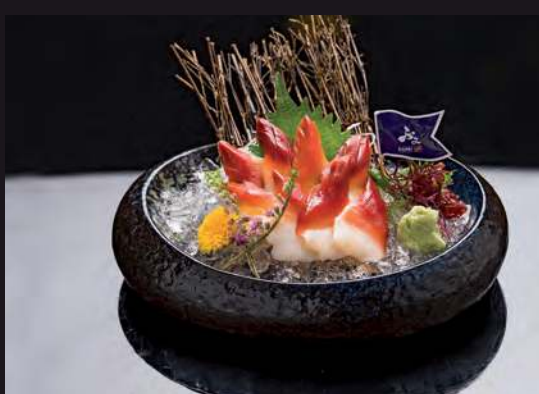
15 HOKKIGAI Surf Clam 北极貝 หอยปีทก 330.-