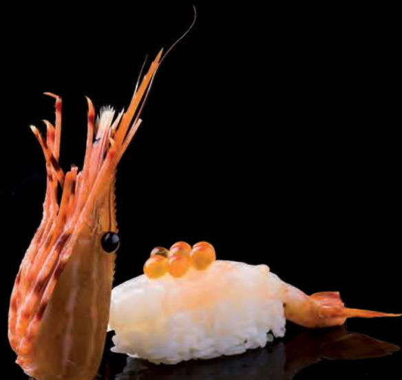
16 BOTAN EBI Botan Shrimp 牡丹虾 กุ้งหวานโตตัน 230.-