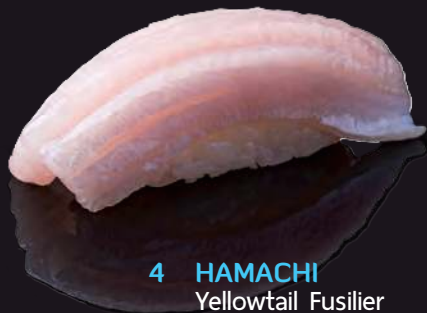
4 HAMACHI Yellowtail Fusilier 油甘魚 ปลาหางเหลือง 120.-