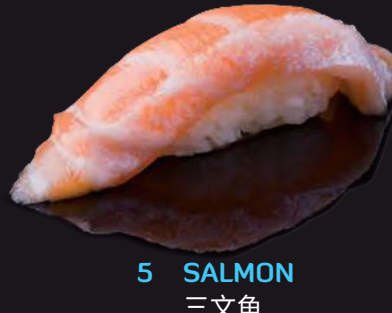
5 SALMON 三文魚 ปลาแซลมอน 90.-