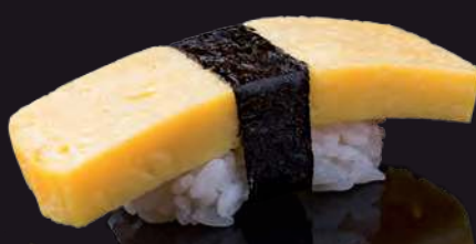
21 TAMAGO Sweet Egg 玉子 ไข่หวาน 50.-