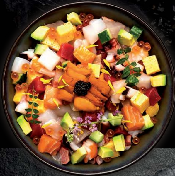
6 BARA CHIRASHI Scattered Various Colorful Raw Fish on Sushi Rice 综合鱼寿司卷 ข้าวซูชิหน้าปลาดิบรวมหั่นชิ้นเล็ก 1,100.-