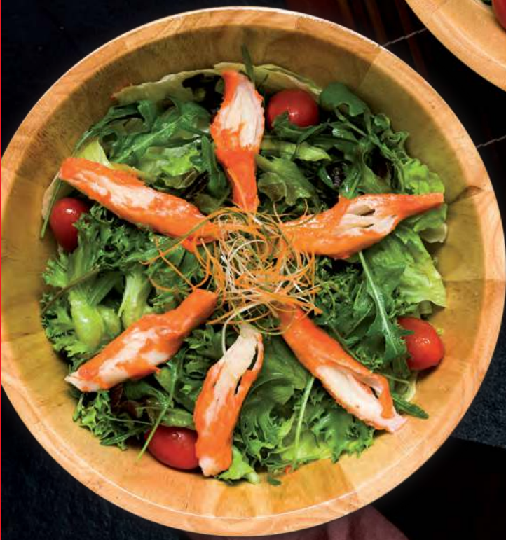
8 KANI SALAD Crab Sticks and Mixed Salad 蟹肉棒沙拉 สลัดปูอัด 250.-