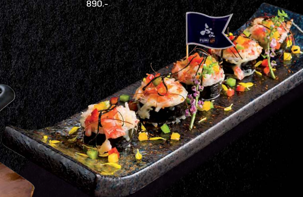
6 PIZZA SUSHI Rolled Sushi Shrimp, Egg, Crab Stick, Tobiko Topped Mozzarella Cheese 虾 鸡蛋 蟹肉棒 花枝 加上辣蛋黄酱起司 พิซซ่า ซูชิ 290.-