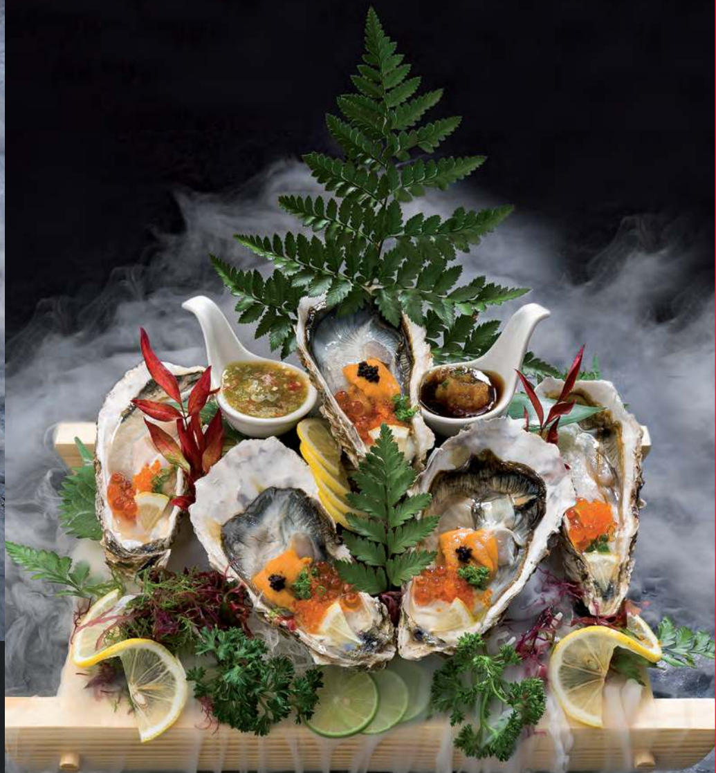
4 KING OYSTERS (5 Oysters) 5顆大牡蛎 หอยนางรมสด 5ตัว 1,500.-