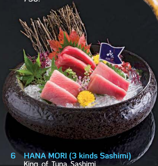
6 HANA MORI (3 kinds Sashimi) King of Tuna Sashimi (Otoro, Chutoro, Maguro Akami) 大鮪魚 中鮪魚 鮪魚肚 ฮานะ ซาซิมิ 1,900.-