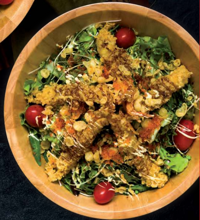
9 EBI TEM SALAD Shrimp Tempura and Mixed Salad 炸虾沙拉 สลัดกุ้งเทมปุระ 350.-