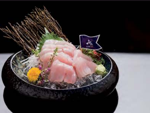
11 SUZUKI Sea Bass 白鯛 ปลากระพงขาว 240.-