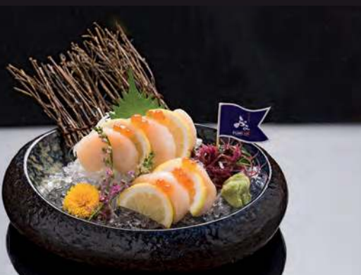
14 HOTATE GAI Japanese Scallop 扇貝 หอยชาล์ 390.-