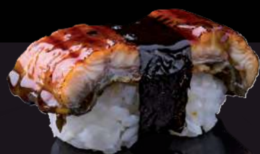
17 UNAGI Eel 河鳗 ปลาไหลน้ำจืด 120.-