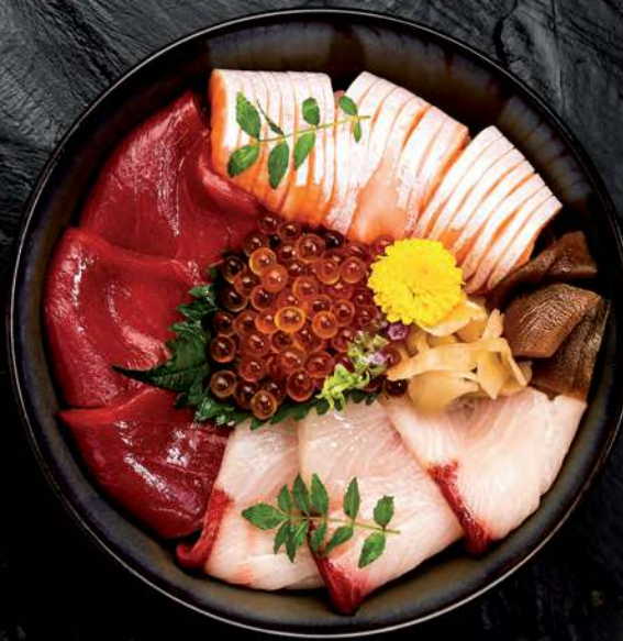
5 SANSHOKU DON Raw Fish topped on Sushi Rice (Hamachi, Maguro Akami, Salmon and Salmon Roe) 油甘鱼 三文鱼 金枪鱼 鲑鱼寿司卷 ข้าวซูชิหน้าปลาฮามาจิ, ปลาทუნ่า, ท้องปลาแซลมอนกับไข่ปลาแซลมอน 750.-