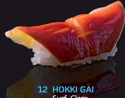
12 HOKKI GAI Surf Clam 北极貝 หอยปีกนก 120.-