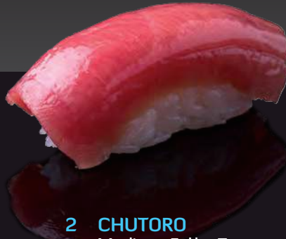
2 CHUTORO Medium Fatty Tuna 中鮪魚 เนื้อส่วนท้องชูโอรุ 450.-