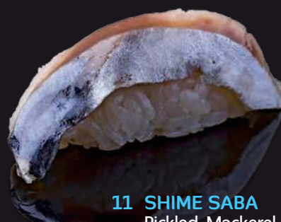
11 SHIME SABA Pickled Mackerel 腌鯖魚 ปลาซามะดอง 80.-