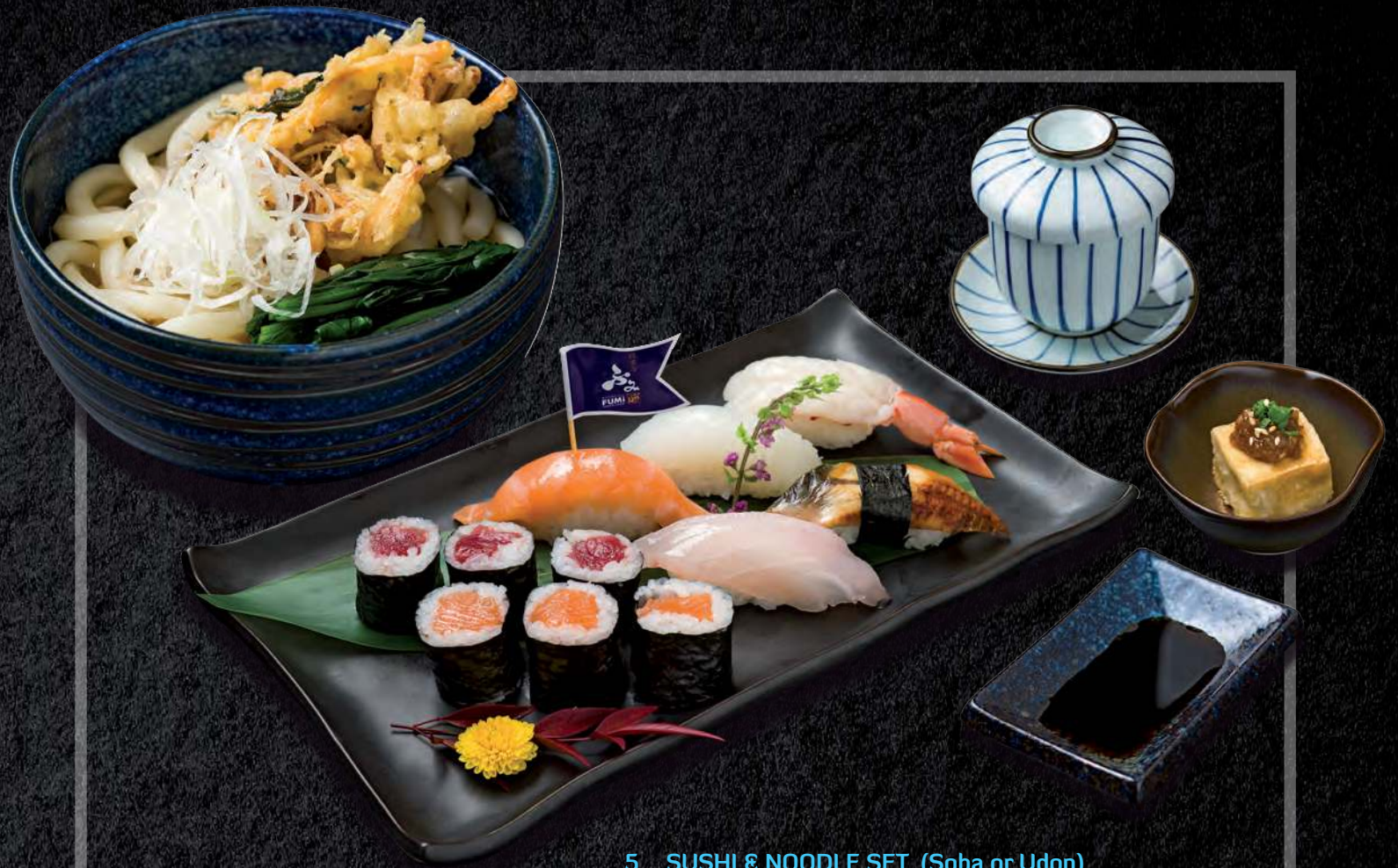
5 SUSHI & NOODLE SET (Soba or Udon) Colourful Assortment of Nigiri and Rolls with Egg Custard and Side Dish 彩色寿司拼盘及蒸蛋小菜 (荞麦面或乌龙面) เช็ตซูชิ แอนด์ บู้ดดี๊ 490.-