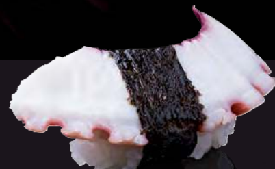
19 TAKO Octopus 章鱼 หนวดปลาหมึกยักษ์ 90.-