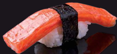
20 KANI Crab Stick 蟹肉棒 ปูอัด 60.-