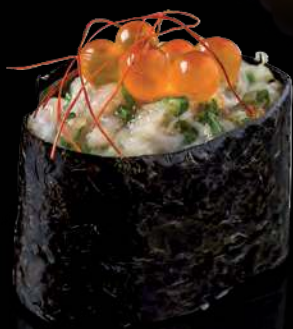
14 TATAKI GUNKAN Mixed Fish chopped with Salmon Roe 综合鱼加三文鱼卵 เนื้อปลารวมสับ กับไข่ปลาแซลมอน 150.-