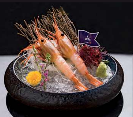
13 BOTAN EBI Botan Shrimp 牡丹蝦 กุ้งหวานโบตัน 490.-