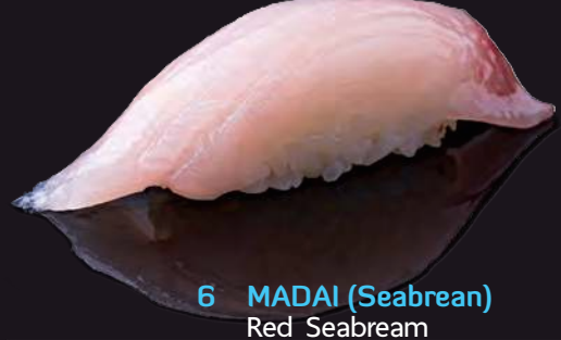
6 MADAI (Seabream) Red Seabream 海鯛 ปลากระพงญี่ปุ่น 150.-