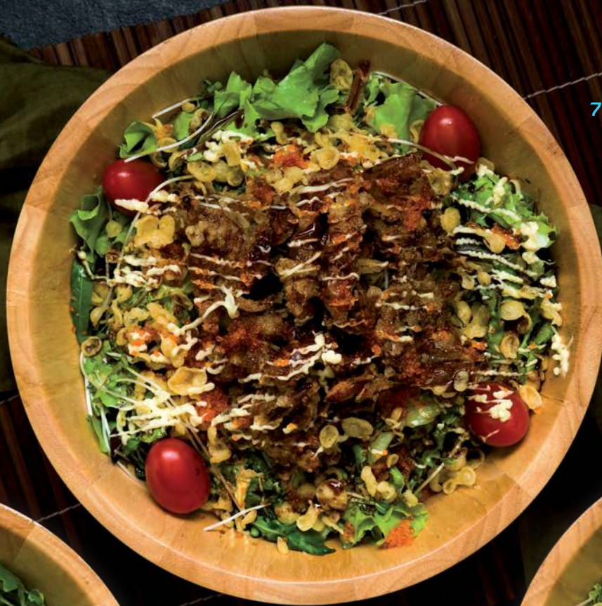
7 SOFT SHELL CRAB SALAD Deep Fried Soft Shell Crab and Mixed Salad 软壳蟹沙拉 สลัดปูนิ่ม 390.-