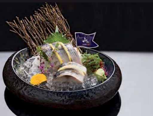
20 SHIME SABA Pickled Mackerel 腌鯖魚 ปลาซาบะดอง 220.-