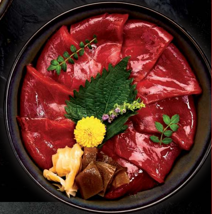
7 TEKKA DON Hon Maguro Akami topped on sushi rice 鲑鱼寿司卷 ข้าวซูชิหน้าปลาทუნ่าญี่ปุ่น 900.-