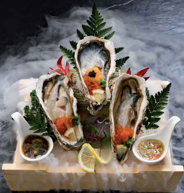
3 KING OYSTERS (3 Oysters) 3顆大牡蛎 หอยนางรมสด 3ตัว 900.-