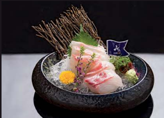
9 MADAI (Seabream) Red Seabream 红鲷 ปลากระพงญี่ปุ่น 550.-