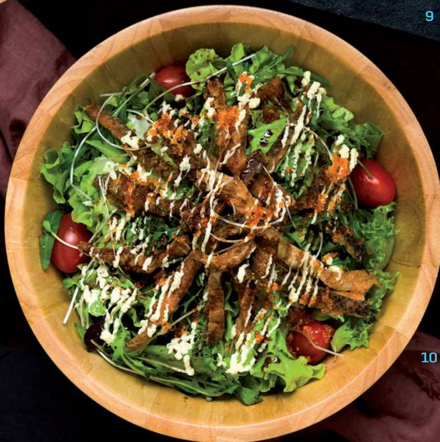
10 SALMON SKIN SALAD Crispy Salmon Skin and Mixed Salad 炸三文鱼沙拉 สลัดหนังปลาแซลมอนทอดกรอบ 300.-