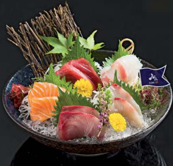
5 TSUKI MORI (5 kinds Sashimi) Sashimi Hamachi, Maguro Akami, Salmon, Madai and Suzuki 油甘魚 鮪魚肚 三文魚 真鯛 鮪魚 ซีกี ซาซิมิ 790.-