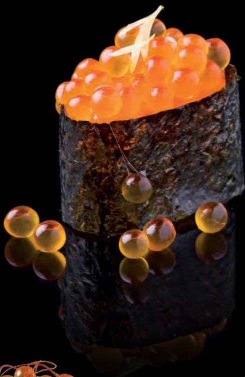
13 IKURA Salmon Roe 三文鱼卵 ไข่ปลาแซลมอน 170.-