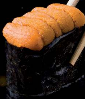
15 NAMA UNI Fresh Sea Urchin 海胆 ไข่หอยเม่น 490.-