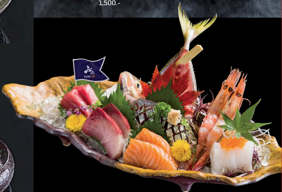
7 YUKI MORI (7 kinds Sashimi) Sashimi Hamachi, Maguro Akami, Salmon, Aji, Ama Abi, Ika and Ikura 油甘魚 鮪魚肚 三文魚 慈魚 甜蝦 花枝 鮭魚卵 ยูคิ ซาซิมิ 1,100.-