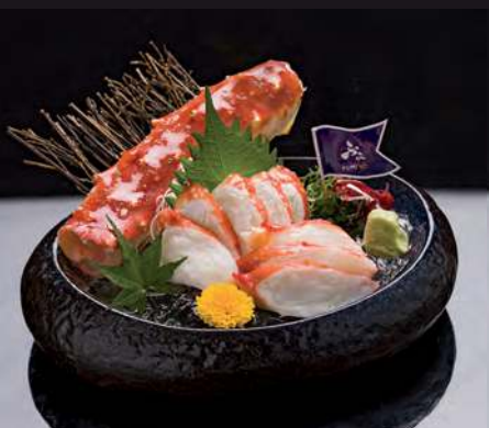
19 TARABA KANI King Crab 帝王蟹 ปูอลาสก้า 1,500.-