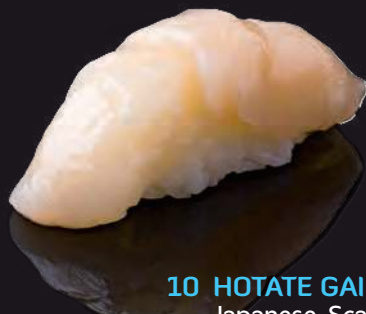
10 HOTATE GAI Japanese Scallop 扇貝 หอยเชลล์ 110.-