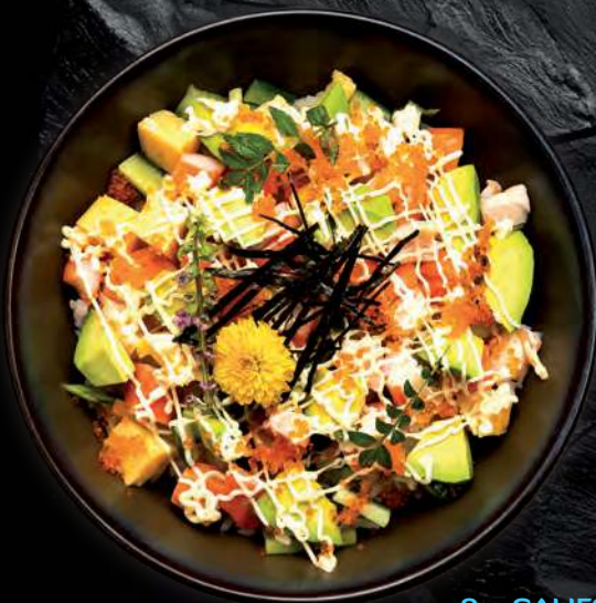
8 CALIFORNIA DON Assortment of Prawn, Crab Stick, Tobiko, Avocado and Asparagus topped on Sushi Rice 虾 蟹肉棒 虾卵 牛油果 芦笋寿司卷 ข้าวซูชิหน้าแคลิฟอร์เนีย 450.-