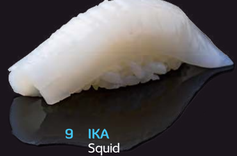
9 IKA Squid 花枝 ปลาหมึกกล้วย 65.-