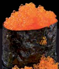
18 TOBIKO Flying Fish Roe 飞鱼卵 ไข่กุ้ง 100.-