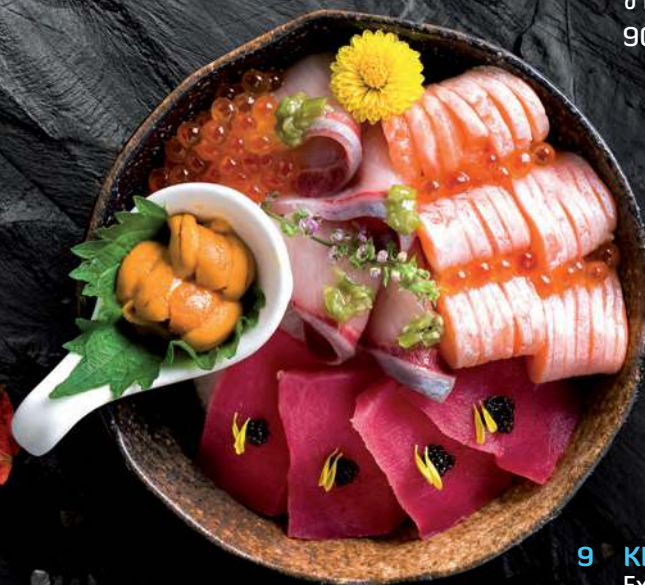
9 KING CHIRASHI Extravagant Lavish Sea's Bounty topped on Sushi Rice (Uni, Ikura, Hamachi, Salmon and Maguro akami) 豪华寿司卷 ข้าวซูชิหน้าปลาฮามาจิ, ปลาทუნ่า, ท้องปลาแซลมอน, ไข่หอยเม่นกับไข่ปลาแซลมอน 1,900.-