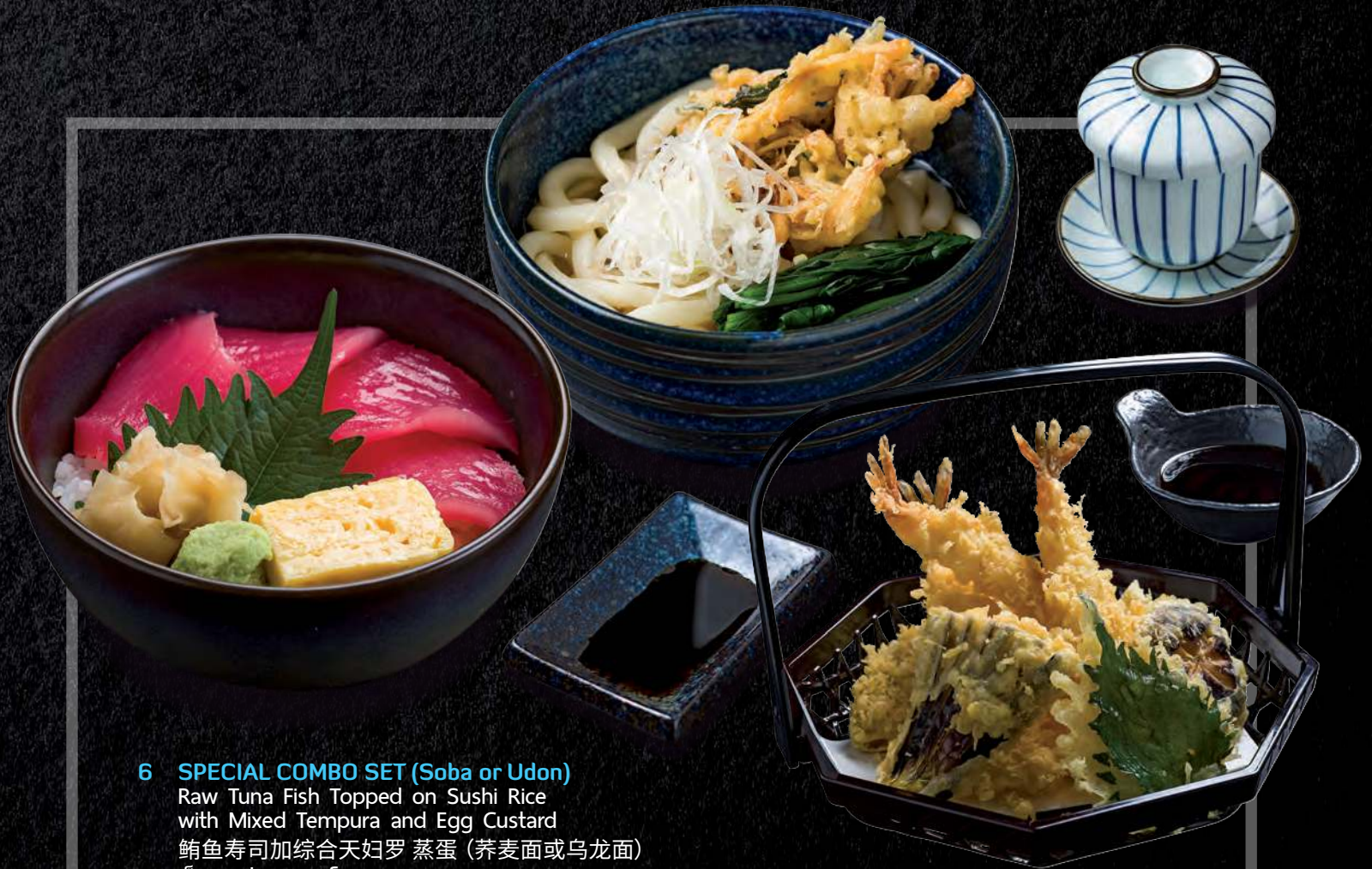
6 SPECIAL COMBO SET (Soba or Udon) Raw Tuna Fish Topped on Sushi Rice with Mixed Tempura and Egg Custard 鲑鱼寿司加综合天妇罗 蒸蛋 (荞麦面或乌龙面) เช็ตคอมโบ เซ็ต 690.-