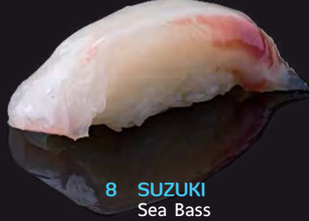
8 SUZUKI Sea Bass 鮚魚 ปลากระพงขาว 60.-